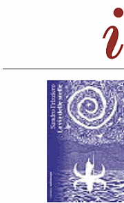
SANDRO FRIZZIERO La via delle stelle NOTTETEMPO Pagine 156, € 18

La narrazione scorre — interamente al tempo presente, senza alcun frammento di dialogo (ed è peculiarità rara nella scrittura letteraria di questi anni) — come in un unico flusso in cui piani temporali diversi si giustappongono senza solu-