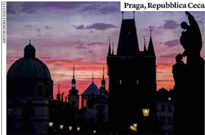
Praga, Repubblica Ceca

Il valore delle etichette è sempre relativo. E infatti nel nuovo romanzo di Miloš Urban, Továrna na maso (Fabbrica di carne), è difficile individuare lo spirito "ruggente" degli anni venti del novecento. Al centro del romanzo c'è un mattatoio che avvelena l'aria di un quartiere alla periferia di Praga. Il protagonista è l'ingegner Leon Hebvábny, che ha il compito di migliorare la reputazione del più grande mattatoio dell'Europa centrale agli occhi degli abitanti, esasperati dai miasmi e dalle urla degli animali. Compito che inizialmente sembra riuscirci. Ma