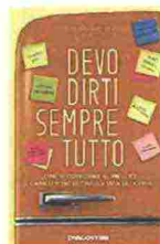
DeAgostini 180 pagine 14,90 euro