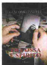
David & Mattheus 126 pagine 12,90 euro