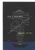
DAVIDE COLTRI DOV'È CASA MIA mminumfax 181 pagine 16 euro