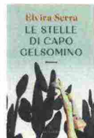
Elvira Serra LE STELLE DI CAPO GELSOMINO Solferino 218 pagine 17 euro

Ci sono farfalle che si posano sui coccodrilli per abbeverarsi dalle loro lacrime. I bruchi del tabacco si scavano la tomba da soli perché la pianta che li nutre libera sostanze che attirano gli insettivori. Le anatre invece sanno al tempo stesso dormire e guardarsi dai pericoli. Alcuni animali hanno sviluppato capacità di adattamento alle situazioni più difficili, altri la vita la subiscono. Capita anche a noi e ce lo ricorda Eva Menasse in otto racconti in cui le vicende umane sono riconducibili a quelle animali. Perché anche se a volte lo scordiamo, noi e loro siamo parte dello stesso regno.