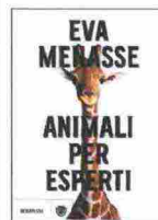
EVA MENASSE ANIMALI PER ESPERTI Bompiani 272 pagine 18 euro