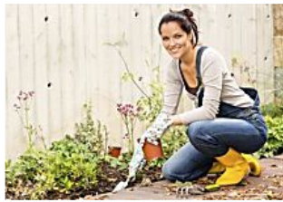
Cura del giardino, ecco svelata la regola delle tre P Desideri Magazine