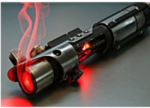
Questa torcia tattica in vendita libera sta creando non poche polemiche notizieweb365.com