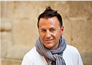
L'incredibile storia di Salvatore: diventa miliardario in un mese newsdiquality.it