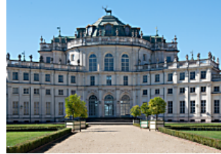
Ecco come la montagna piemontese conquista a 360° viaggi.corriere.it