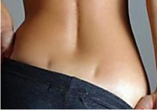
Le fossette di Venere: ecco cosa significano e perchè sono considerate sexy [Foto] social.blog.it