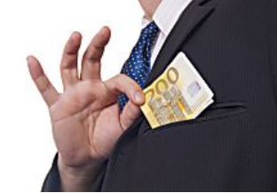
Trading online, ecco i consigli da non perdere Marketing Vici