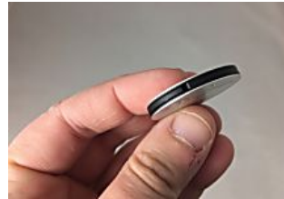
Come localizzare gratis la tua auto tramite cellulare? Gadgetsfans