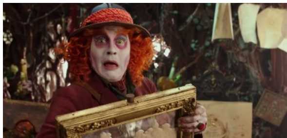
I libri da leggere nel 2016 prima che diventino film