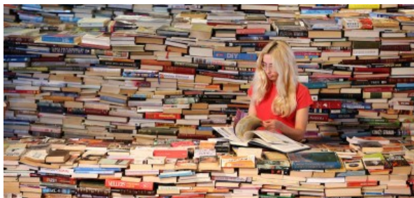
10 cose successe nel 2015 nel mondo dei libri