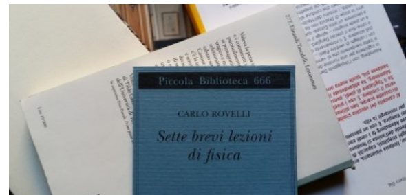
Il caso editoriale dell'anno