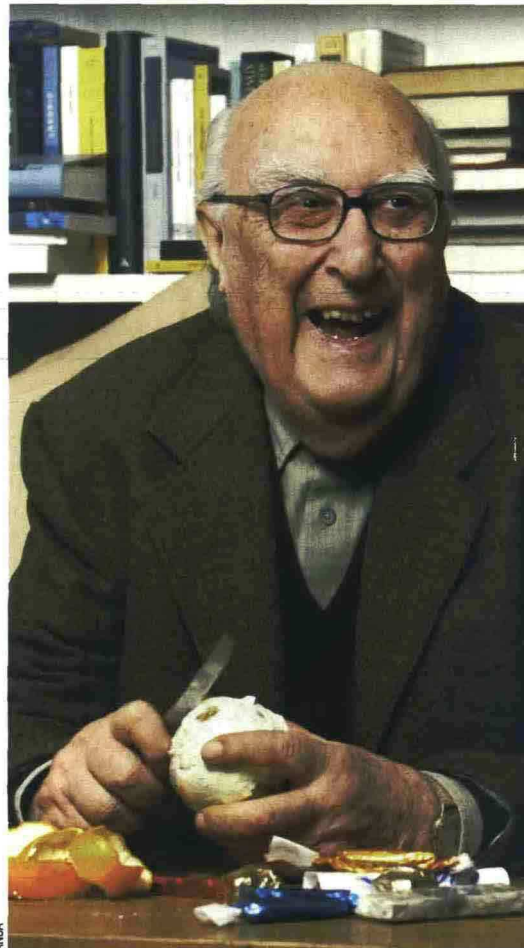
Anni 83, libri pubblicati più di 40, ecco lo score di Andrea Camilleri, re del bestseller italiano

senso Un sabato, con gli amici è un libro moraviano, anzi è il libro moraviano per eccellenza, Gli indifferenti . Mi spiego. Moravia disse sempre che quando si trovò a scrivere Gli indifferenti non usò modelli romanzeschi, esempi narrativi. Si ispirò, invece, per la costruzione a un autore da lui amatissimo in giovinezza: Carlo Goldoni. Gli indifferenti è scritto come si scrive un dramma teatrale, i personaggi entrano ed escono dalle stanze del romanzo così come gli attori entrano ed escono di scena. La stessa cosa succede in Un sabato, con gli amici . È la storia di alcune coppie variamente assortite e variamente legate tra di loro (amori in corso, vecchi amori, tradimenti, patti di mutuo soccorso), delle quali sappiamo la ferita più o meno grave, il trauma che subirono nell'infanzia (morte di un genitore, adulterio di un genitore, assassinio di una bambinaia, assassinio di una sorella, incesto mamma-figlio da elaborazione del lutto ecc.), ferita e trauma che li segnano per sempre, marchiano il loro destino,