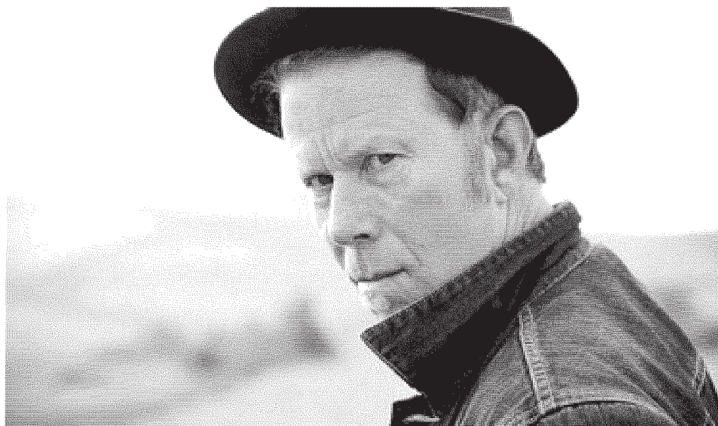
Tom Waits in una foto di alcuni anni fa e in un'altra immagine più recente