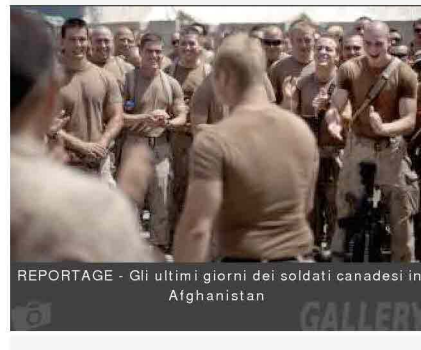
REPORTAGE - Gli ultimi giorni dei soldati canadesi in Afghanistan