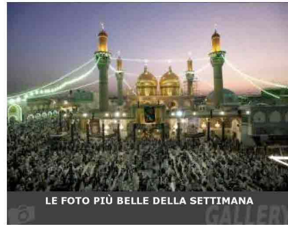
LE FOTO PIÙ BELLE DELLA SETTIMANA

Devi aver fatto log-in per inserire un commento.