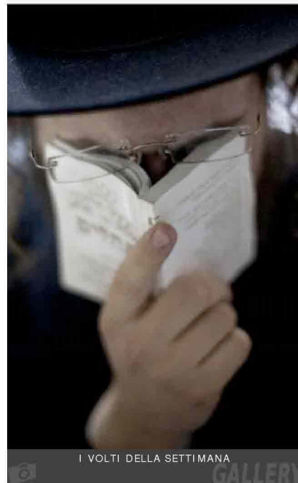
I VOLTÌ DELLA SETTIMANA