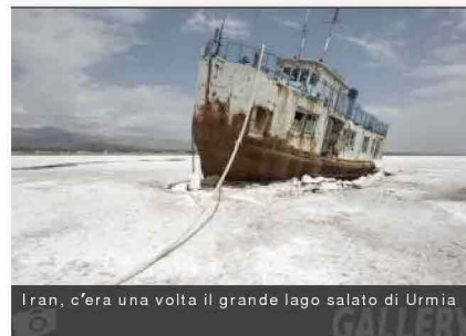
Iran, c'era una volta il grande lago salato di Urmia