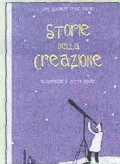
J. Schubiger, F. Hohler Storie della Creazione

nocciolo di prugna, per non parlare di cosa è successo quando Adamo ed Eva — che, bisogna ammetterlo, erano due gran padiccioni — si sono visti per la prima volta. Il libro di Scgubiger e Hohler è arricchito dalle belle illustrazioni di Jutta Bauer ed è suggerito per la lettura dai 6 anni in su, anche se in effetti può essere letto a tutte le età.