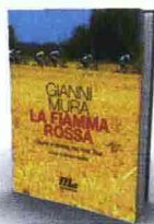
IL LIBRO LA FIAMMA ROSSA di Gianni Mura Minimum Fax (pag. 464, € 17,50)

(budello di maiale ripieno di interiora di maiale e affumicato per circa sei settimane con legno di faggio) e il bourriol (crêpe di grano saraceno farcita di patate, pancetta, formaggio filante);