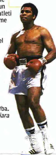
IL LIBRO QUEL PUNCH! Autori vari Ci Vediamo pag. 20, € 15

immagini di un k.o. e infine atleti in attività come Jean-Marc Mormeck (campione del Mondo dei massimi leggeri fino alla fine del 2007) e Brahim Asloum, campione in carica dei minimosca Wba. Filippo Di Chiara