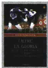
OLTRE LA GLORIA David Margolick Il Saggiatore pag. 431, € 23