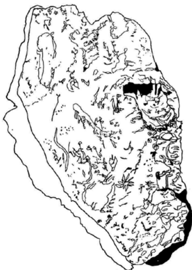
WITCH-HEAD ROCK, CORNWALLIS ISLAND

la fine restano anonimi, non letti, dimenticati; e così deve essere, perché così è la vita. Mi torna in mente un libro che quasi è intonso, intoccato, mai compulsato; si chiama The Quest for Polar Treasures . Parla del pesce diavolo, «il terrore di tutti gli uomini polari», che ha quattro paia di zampe e orecchie da pipistrello; rotola sugli uomini e li uccide stritolandoli. Parla di una meteora di sei metri incastrata nel ghiaccio, con il nucleo metà scorie e metà ottone. Racconta la storia della spedizione Kaminerorov del 1903, quando venticinque uomini annegarono sotto un'onda mostruosa; gli scampati eressero a monumento uno dei compagni congelati nella neve, con la pistola in mano. Sono tutte frottole, e piuttosto interessanti. Sono sicuro che qualunque targa in ricordo dei trentatré anni di Levi a Resolute sarebbe uguale. Leggiamo le nostre storie e sorridiamo proprio come il cielo sorrideva serio e gelido da uno spiraglio azzurro fra le nuvole.