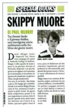
Paul Murray Skippy muore Isbn Edizioni

Per la collana Track di No Reply dedicata al racconto delle pietre miliari della musica rock, pop soul punk blues italiane e straniera, esce un saggio dedicato a Swordfishtrombones , uno dei lavori più intensi di Tom Waits. Non si tratta di un semplice racconto cronologico sulle varie tappe di registrazione dell'album, ma di una vera sequenza di storie e di curiosità su questo eccellente lavoro. La postfazione è affidata al cantautore Dente.