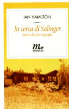
Ian Hamilton In cerca di Salinger Minimum Fax

Romanzo di formazione atipico, sostenuto da una scrittura brillante, Skippy muore ha come protagonisti Daniel 'Skippy' Juster e Ruprecht Van Doren, compagni di stanza al Seabrook College di Dublino. Una sera, in un locale, i due fanno a gara a chi mangia più ciambelle e Skippy diventa rosso in viso, stramazza al suolo e muore in pochi minuti. Da questa fatale competizione prende il via una tragicomica avventura, fatta di piccole e grandi storie.