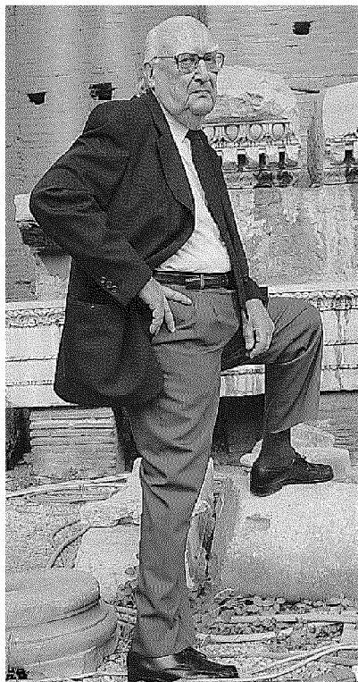
► Andrea Camilleri