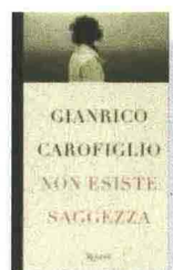
GIANRICO CAROFILGIO Non esiste saggezza Rizzoli, 2010 pp. 244, euro 14,00