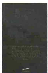
CHARLOTTE LINK Nobody Corbaccio, 2010 pp. 522, euro 19,90