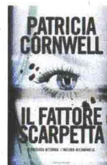
PATRICIA D. CORNWELL Il fattore Scarpetta Mondadori, 2010 pp. 417, euro 20,00