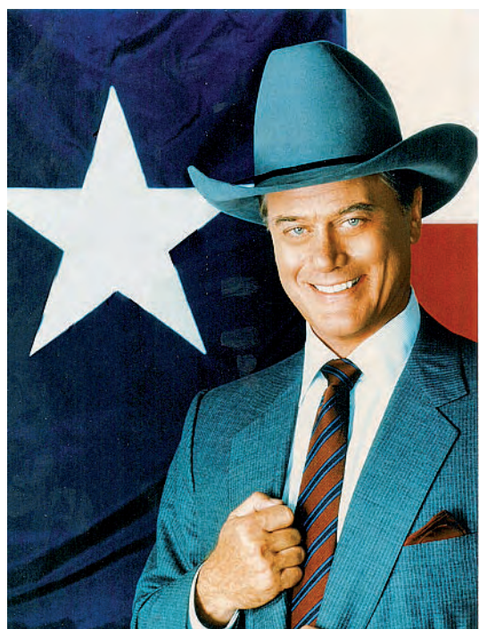
Larry Hagman, il J.R. di «Dallas», un cult degli anni '80