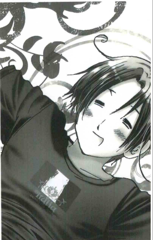
H. HIDEKAZ/GENTOSHA COMICS

Hetalia? Più o meno Italia fiona. Poi ecco Francia, Usa... un mangra sulle nazioni un po' rozzo