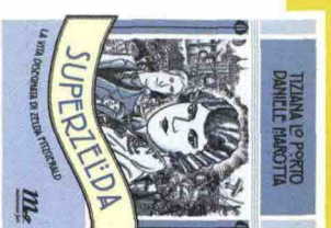
SUPERZEIDA TIZIANA LE PORTO DANIELE MAROTTA

Ma nel 2011, in particolare, si è definitivamente consolidata la dignità letteraria della graphic novel, di cui Superzeida è uno splendido esempio in cui documentazione storica, letteratura, biografia, costume e studio iconografico fluiscono elegantemente nelle tavole disegnate. In questa storia per immagini si narrano le vicende di Zelda Sayre: ballerina, scrittrice e pittrice che fu non solo musa tormentata di Fitzgerald, ma che creò, incarnandolo, un nuovo modello di femminilità, fonte di ispirazione per le generazioni a venire. È un esperimento assolutamente da ripetere quello di mettere in scena personaggi classici attraverso un linguaggio ipermoderno, visto che è stato capace di tracciare un ritratto raffinato e accurato della coppia simbolo della "generazione perduta", Scott e Zelda Fitzgerald.