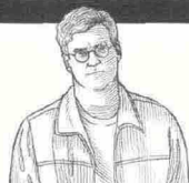
Jonathan Dee I privilegiati NERI POZZA, 2010

L'avidità di Doug Funning, giovane banchiere, è la stessa della banca di cui è dipendente e dell'intero sistema finanziario. Solo una vecchia insegnante di storia si oppone.