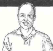
Adam Haslett Union Atlantic EINAUDI, 2010

Se il Grande Gatsby è il miglior racconto della crisi degli anni Trenta che si possa leggere, anche oggi i romanzieri americani non rinunciano a entrare nel vivo della cronaca e della storia. E forse la loro chiave di lettura è più autentica di quelle di tanti sociologi o economisti.