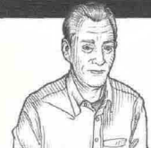
Paul Auster Sunset Park EINAUDI, 2010

Le fabbriche chiuse e le acciaierie dismesse della Pennsylvania si ossidano mentre Isaac English, vent'anni e un cervello da genio, cerca di imitare la madre suicida.